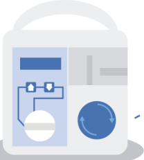
Bomba de Nutrición Enteral

Se realiza a través de una sonda nasogástrica para evitar broncoaspiraciones, hasta que se controle la deglución (oral o IV según el estado del paciente)