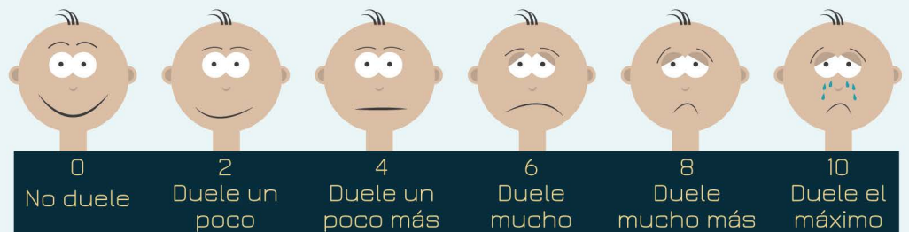
Escala de caras de dolor Wong-Baker